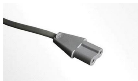
Figura 1 Exemplo de tomada da almofada de ligação à terra

Quando utilizar a Cânula Afunilada/com Ligação à Terra com um instrumento monopolar, o acoplamento capacitivo (correntes parasitas) pode provocar a acumulação de uma carga elétrica sobre a cânula, porque esta pode não estar em contacto direto com o paciente. Para prevenir esta situação, a Cânula Afunilada/com Ligação à Terra tem uma tomada de ligação à terra compatível com elétrodos dispersivos no paciente (almofadas de ligação à terra) com um conector de 2 pinos e uma área mínima da superfície condutora de 137 cm 2 .