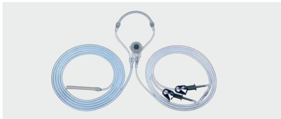
Conjunto de mangueiras de irrigação

031328-10* Conjunto de mangueiras de irrigação , com duas cânulas de punção, utilização única, estéril, embalagem com 10 unidades