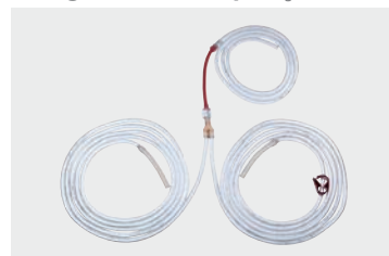
Conjunto de mangueiras de aspiração