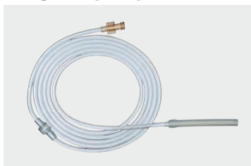
Mangueira para paciente