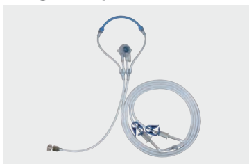
Conjunto diário de mangueiras para bomba