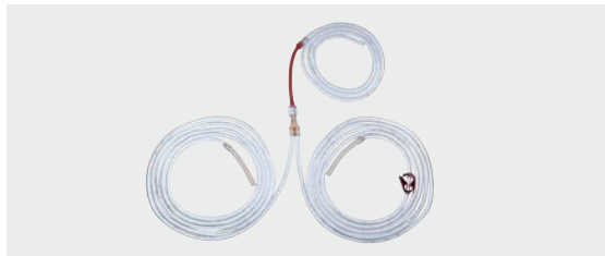
Conjunto de mangueiras de aspiração